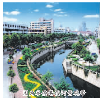
图为谷熟港滨河景观带

年,张家港将塑造城市个性和特色作为一项打造城市人居环境的重要内容来抓,努力营造布局合理、街景协调、空间尺度宜人、设计施工精细的城市风貌。一是推行规划和建筑方案招标制度;二是实施夜景灯光工程;三是以生态理念改造老城;四是大力实施公交优先战略。