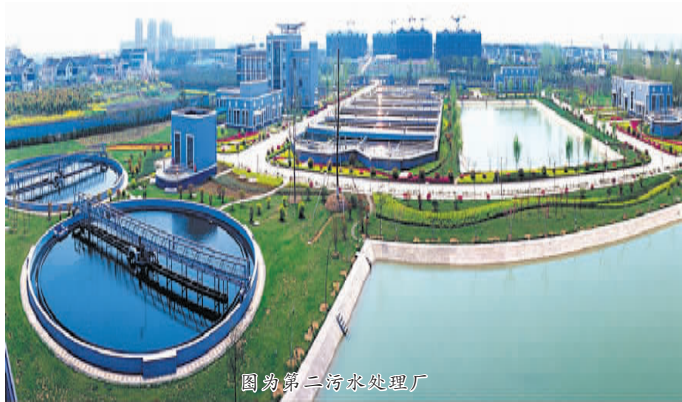
图为第二污水处理厂

张家港市在1995年获得建设部“全国城市环境综合整治优秀城市”称号,1996年获得环保总局“全国环境保护模范城市”称号的基础上,继续深入开展城市环境综合整治工作,进一步改善人居环境质量,推动环境与经济的协调发展。