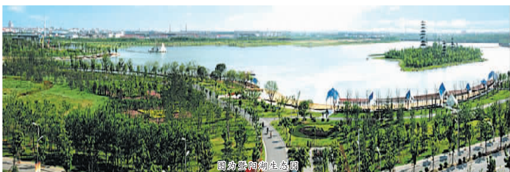
图为暨阳湖生态园

着力拓展物业管理覆盖面。目前,市区新建小区全部实行了物业管理;对于老住宅区,我们通过配套相应的设施,加强政策引导,逐步推行社会化、专业化、市场化的物业管理模式,改善老住宅区的整体环境。