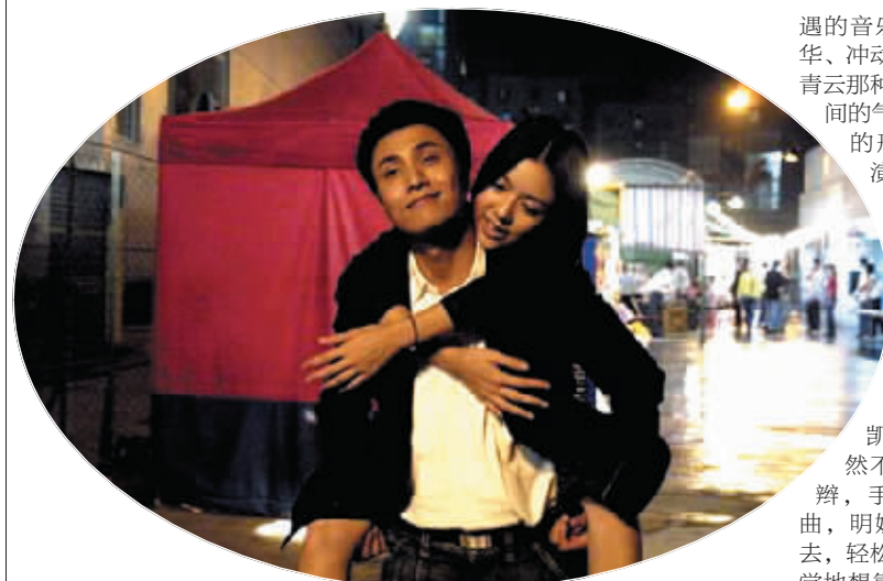
▼ 热恋中的男女主角。

13年前,由香港著名导演尔冬升执导,汇集了袁咏仪、刘青云、刘嘉玲等众多明星的电影《新不了情》红极一时;13年后,剧本仍是老剧本、导演仍是尔冬升,却创造出截然不同的经典——电视剧版的《新不了情》。