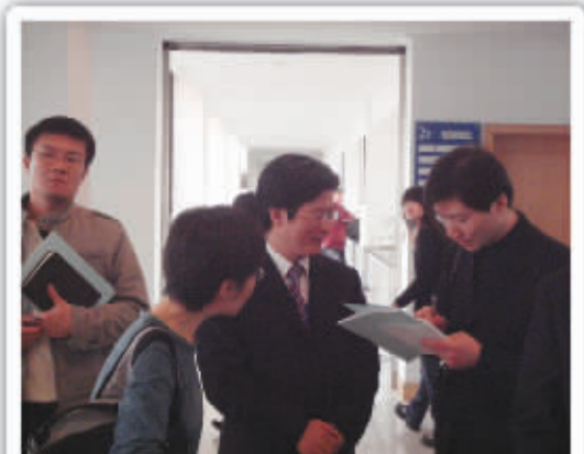
由中纪委、监察部、国务院新闻办组织的中外媒体记者采访该中心

难而上,认真贯彻上级的各项规定,努力完成新形势下赋予的各项任务,发挥招标采购在政治、经济和社会中的应有作用,圆满完成招标采购人应尽的义务。