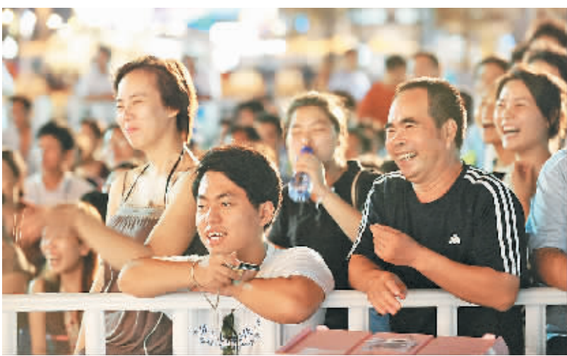
被“永远是春天”主题晚会吸引的游客。