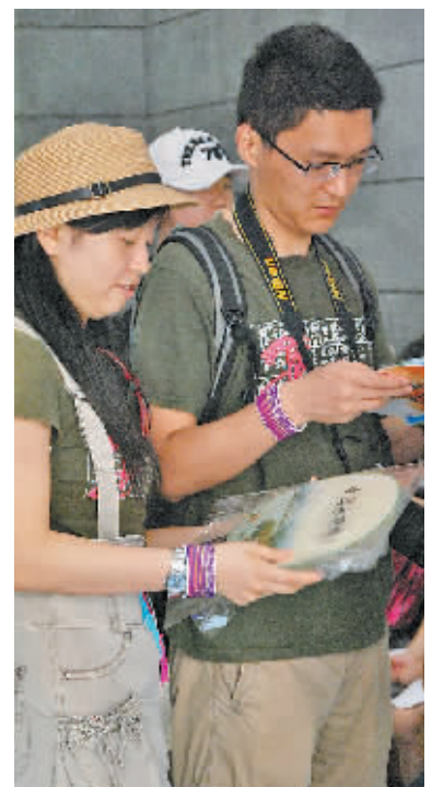
拿到免费团扇的游客迫不及待地观赏起扇面的“永联美景”。