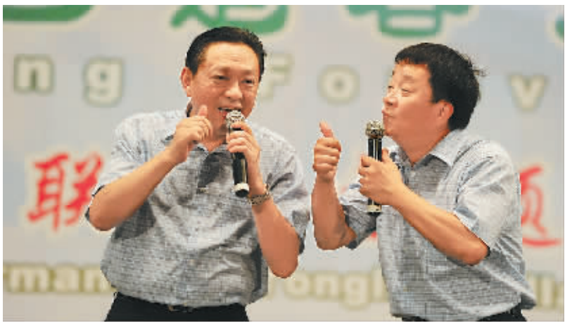
上海人民滑稽剧团的演员倾情演绎“永联故事”。